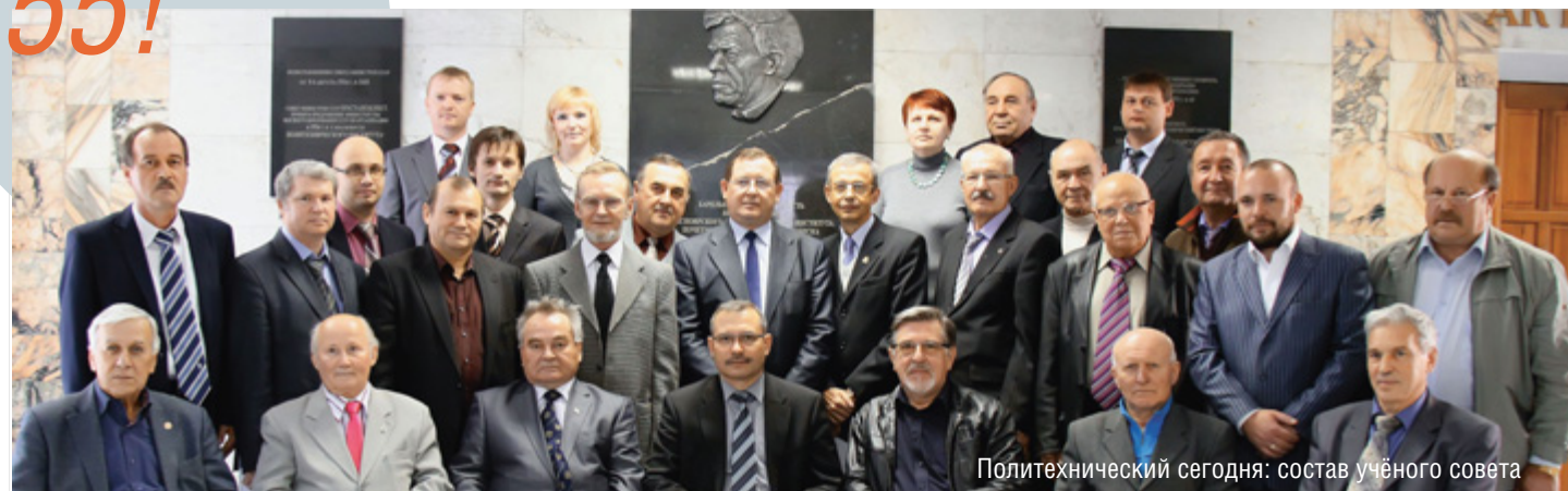
Политехнический сегодня: состав учёного совета