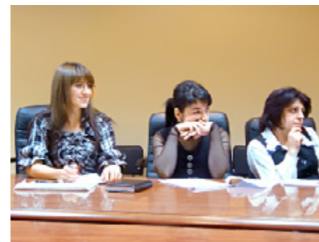
В Гуманитарном институте прошла серия круглых столов «Диалог культур в пространстве Красноярского края: дискуссии по актуальным проблемам межкультурных отношений»

— Современные студенты — это люди, которые в ближайшем будущем будут определять экономический, политический, социальный и культурный облик края, занимая значимые профессиональные ниши, принимая ответственные решения. Хотелось бы надеяться, что у этих людей более или менее сформировалась осознанная жизненная и гражданская позиция, и, в силу универсальности получаемого высшего образования, они менее подвержены различным социальным фобиям.