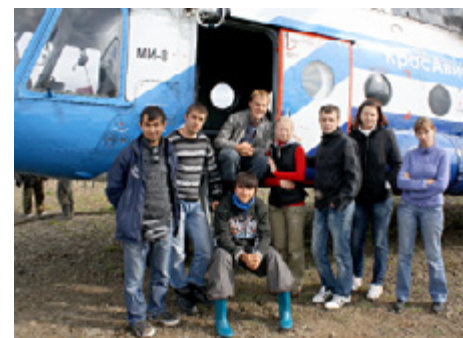
Фото из летней экспедиции 2011 г.