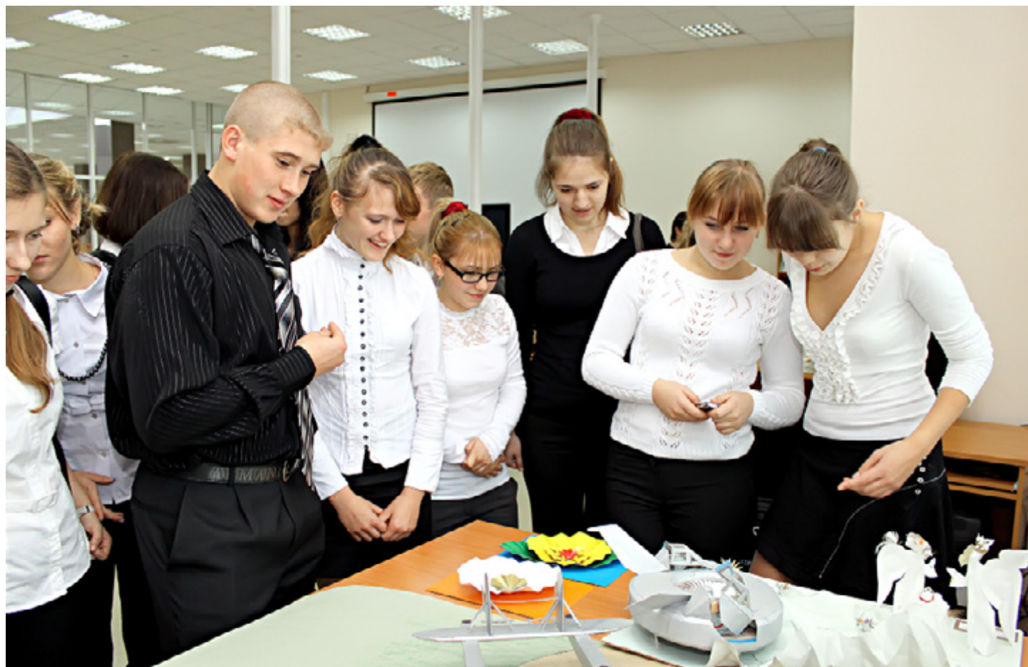
Школьники Манского района на экскурсии в библиотеке СФУ рассматривают экспозиции работ студентов-архитекторов