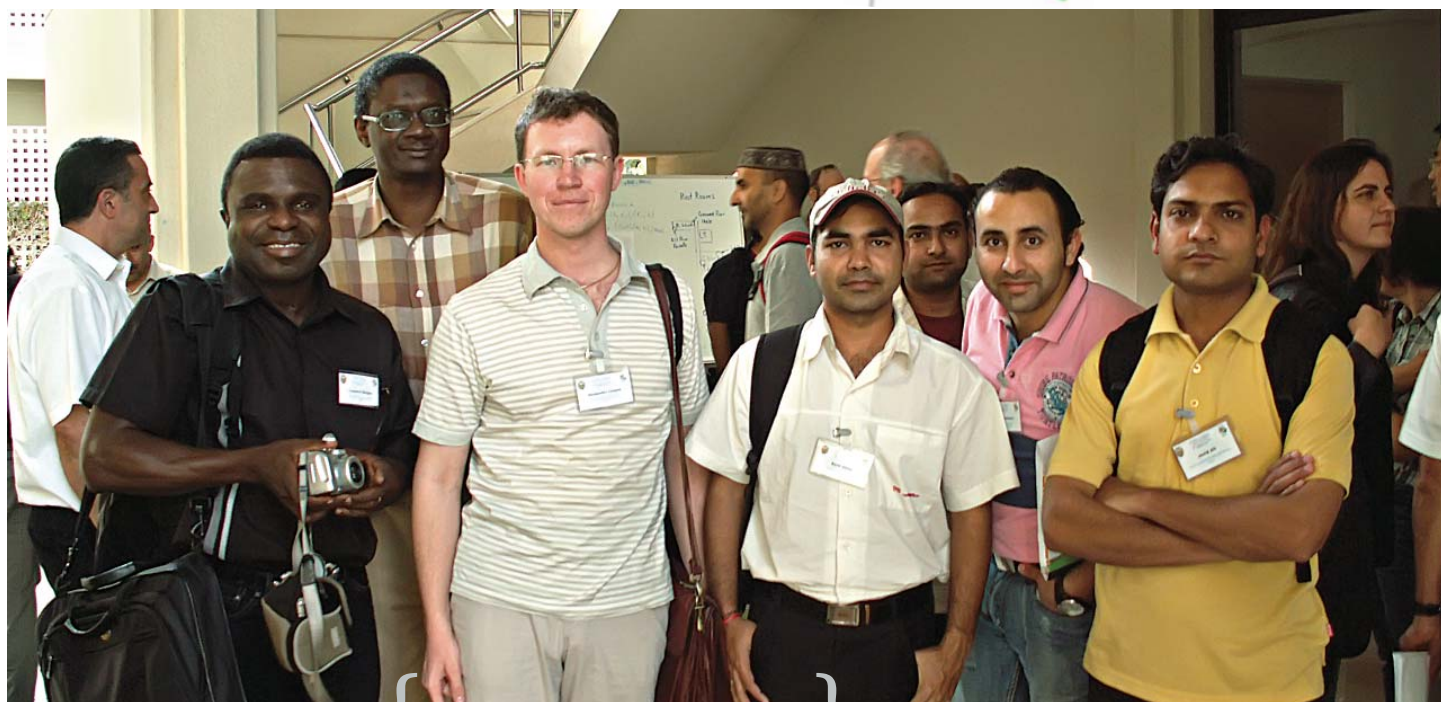
Александр с коллегами