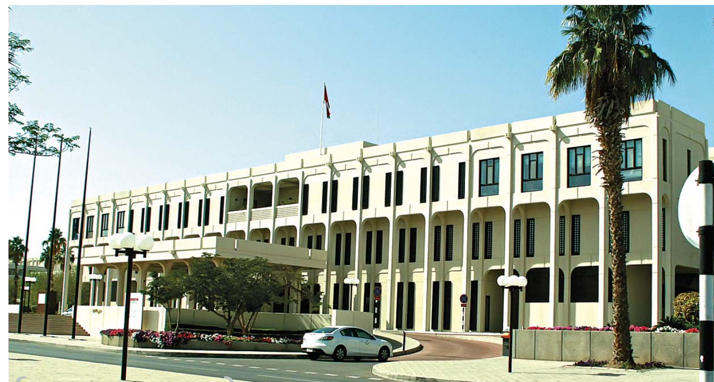
Главное здание университета

Несмотря на отсутствие спиртных напитков всем было хорошо и весело проводить время за поеданием фруктового салата и разговорами.