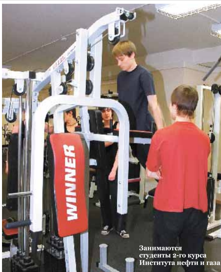
Занимаются студенты 2-го курса Института нефти и газа

Приходите и вы заниматься настольным теннисом. Вечером с 19.00 до 21.00 студенты всего Сибирского федерального университета, предъявив студенческий билет, могут играть в пинг-понг в свое удовольствие. Адрес: ПИ СФУ, корпус «Г», 4 этаж.