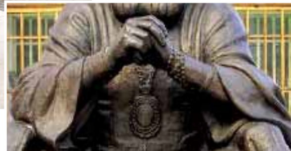
Памятник Кутакирпун-исторического музейного комплекса; Памятник архиепископу Луке Войно-Ясенецкому.

Какие произведения также оказались в студенческом рейтинге значимых произведений города – помогут догадаться фотофрагменты.