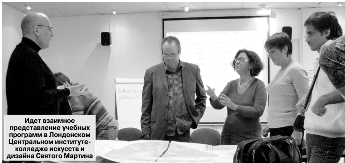
Идет взаимное представление учебных программ в Лондонском Центральном институте-колледже искусств и дизайна Святого Мартина