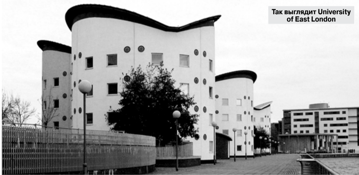
Так выглядит University of East London