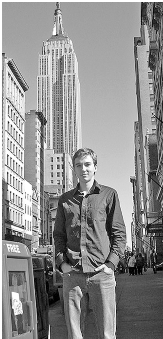
Эмпайер Стэйт Билдинг во всей красе.

Период трудоустройства оказался сложным и напряженным. Могу сказать, что мне очень повезло. Среди всего прочего, я заполнил анкету на сайте одной из крупнейших американских торговых сетей Walgreens, и, к моему удивлению, буквально через пару дней мне позвонили и пригласили на собеседование. Я был в восторге, когда понял, что совсем скоро могу получить работу в магазине, расположенном на первом этаже Эмпайер Стэйт Билдинг на «34 улице», без преувеличения, самом знаменитом здании Нью-Йорка!