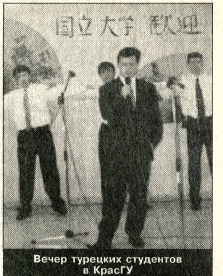
Вечер турецких студентов в КрасГУ

— программу для будущих руководителей государственных и общест-