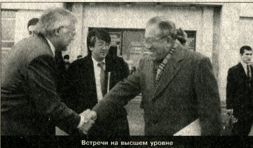
Встречи на высшем уровне