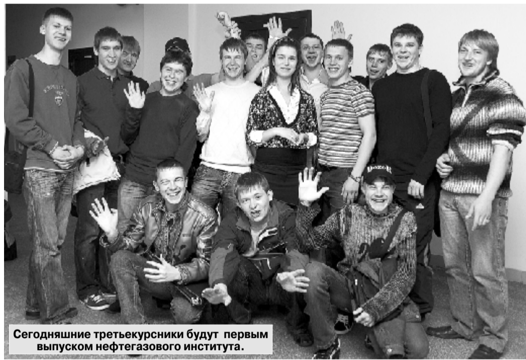
Сегодняшние третьекурсыники будут первым выпуском нефтегазового института.