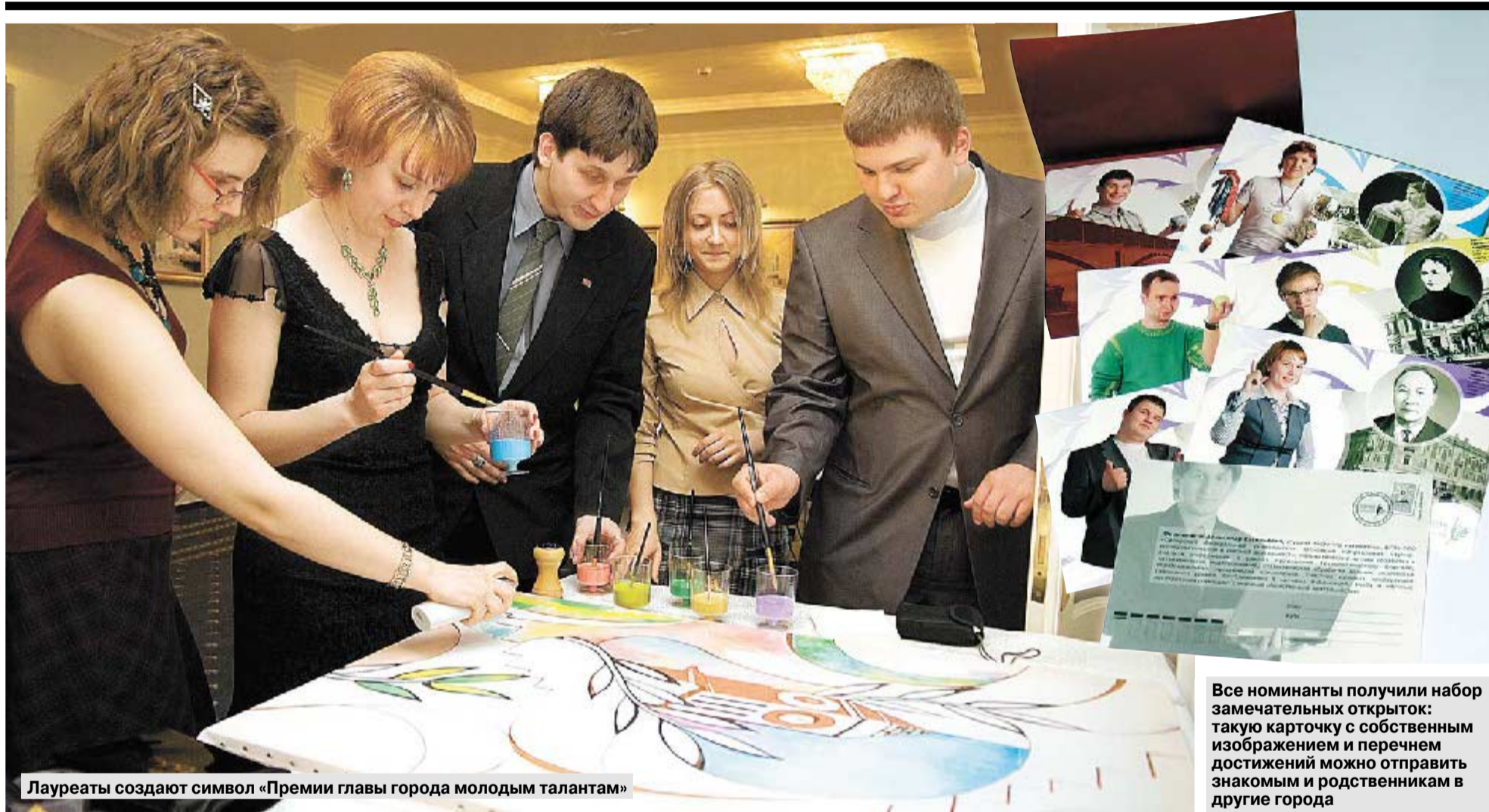
Лауреаты создают символ «Премии главы города молодым талантам»

Все номинанты получили набор замечательных открыток: такую карточку с собственным изображением и перечнем достижений можно отправить знакомым и родственникам в другие города