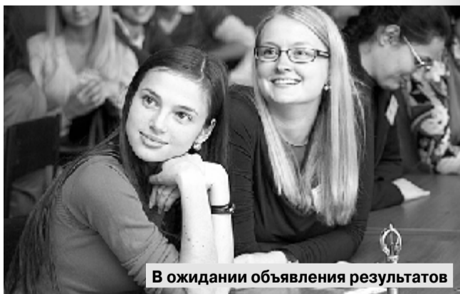
В ожидании объявления результатов

Что ни говори, а финал был действительно интересным.