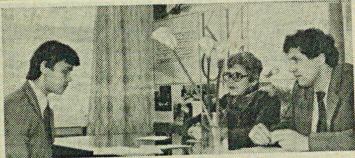
НА СНИМКЕ: «На госэкзамене по научному коммунизму».

БОЛЬШАЯ часть комсомольцев имеет постоянные поручения в группах, но что за этим стоит? Ответственный за УВК доводит (в лучшем случае) до студентов группы итоги по 2-м контрольным неделям. Именно воспитательная работа практически отсутствует — нет воздействия на неуспевающих студентов, не поощряются (кроме повышенной стипендии от деканата) хорошисты и отличники. Члены редколлегии (опять-таки в лучшем случае)