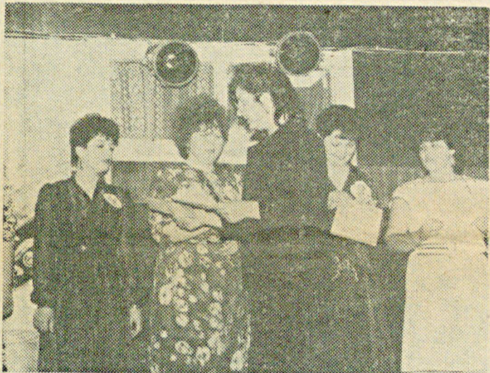
НА СНИМКАХ: КВН в общежитии № 1.