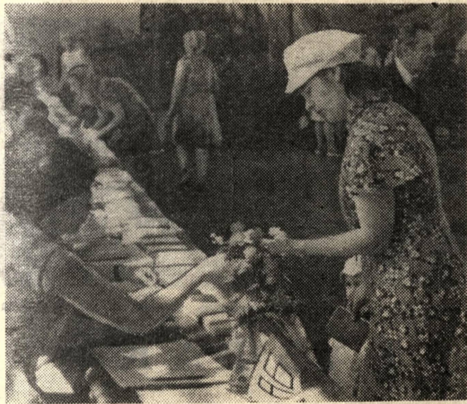
15 июня. На избирательном участке Октябрьского района Красноярска.

Итоги выборов, единодушное голосование за кандидатов блока коммунистов и беспартийных еще раз продемонстрировали торжество советской демократии, безграничное доверие широких масс трудящихся ленинской партии.