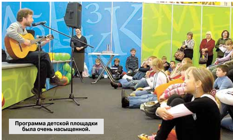
Программа детской площадки была очень насыщенной.