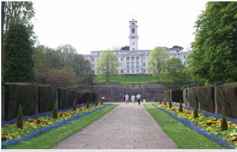
На фото: вид на главное здание Ноттингемского университета

За полгода пребывания в Англии мне не удалось познакомиться с русскоговорящими людьми. Такая языковая изоляция, несомненно, пошла на пользу. Например, мои коммуникативные навыки быстро превзошли навыки аспирантки второго года обучения из Китая, поскольку большую часть времени она общалась со своими соотечественниками. Так что, если хотите выучить язык, избегайте «своих».