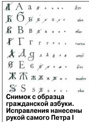
Снимок с образца гражданской азбуки. Исправления нанесены рукой самого Петра I

Петровская реформа имела продолжение: преобразованная азбука подвергалась некоторым изменениям и в последующие годы. Так, в 1735 г. распоряжением Академии наук были исключены еще 2 буквы: во-первых, буква s (зело), которая еще в древности совпа-