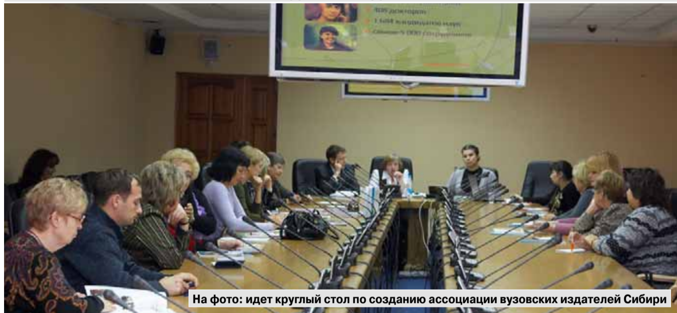
На фото: идет круглый стол по созданию ассоциации вузовских издателей Сибири