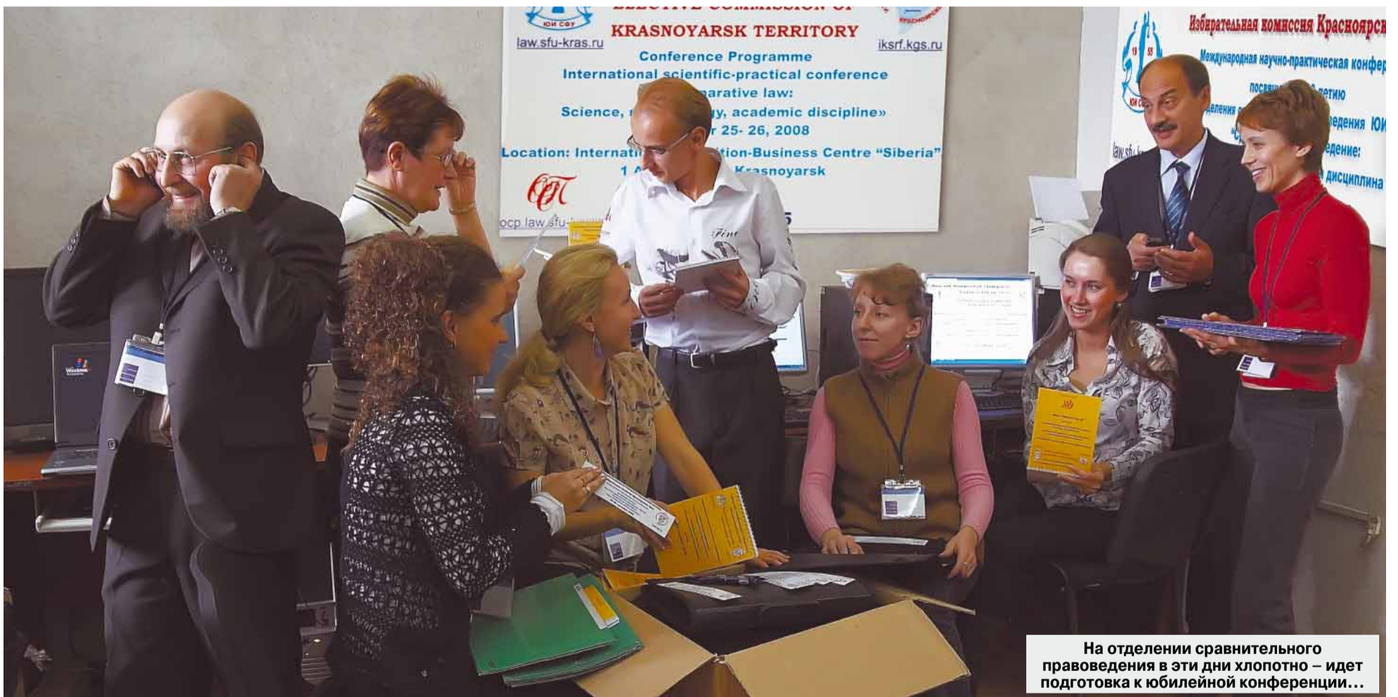
На отделении сравнительного правоведения в эти дни хлопотно – идет подготовка к юбилейной конференции...