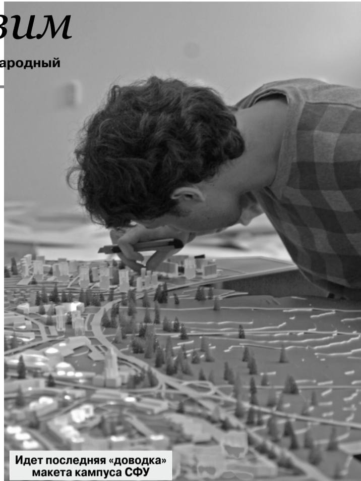
Идет последняя «доводка» макета кампуса СФУ

Кроме делегации СФУ, Красноярский край будет представлен такими структурами, как Монолитхолдинг, Горнохимический комбинат, Богучанская ГЭС, Крастьяжмашэнерго, проекты «Южный берег», «Ергаки» и др.