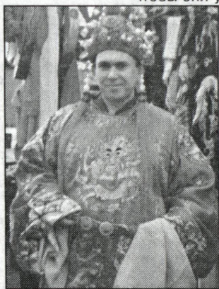
В costume артиста китайской оперы

Сколько я помню с детства, главное достоинство человека — трудолюбие. Мне очень повезло, что я родился и вырос в Ленинском районе и год даже работал слесарем на Красмаше. В то время это было сообщество рабочей интеллигенции, людей самой высокой культуры. Умеющий работать, любящий и уважающий свой труд человек, не важно, профессор или дворник — это красивый человек. И лишь красота может спасти наш мир.