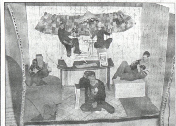
Фрагмент (!) стенгазеты-победителя. С фигурками жильцов и гостей...