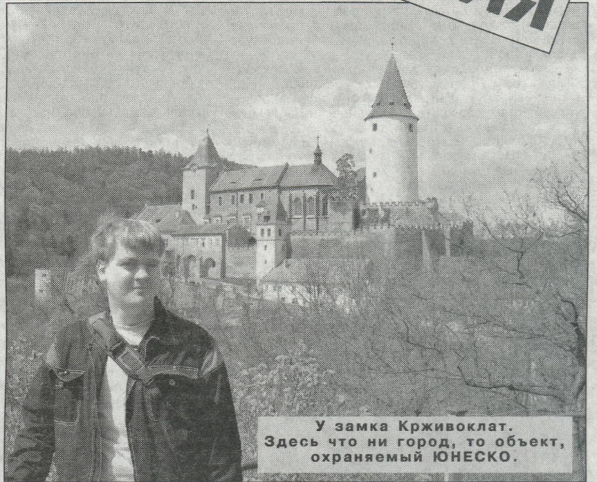
У замка Крживоклат. Здесь что ни город, то объект, охраняемый ЮНЕСКО.

Впрочем, самое главное сходство чехов с хоббитами — их умение остаться незамеченными. Всё потому, что чехи осторожны в выборе новых знакомых из числа иностранцев.