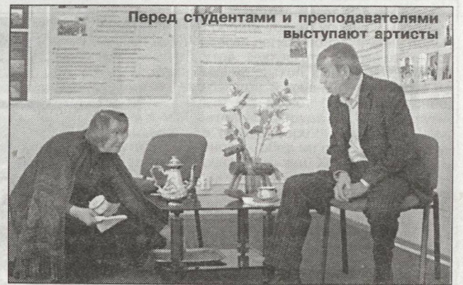
Перед студентами и преподавателями выступают артисты

В.П. Астафьев (документальная запись): "По внешним признакам интеллигентности не бывает. Я встречал дикарей, которые университеты кончали, а есть необразованные — интеллигенты. И наш интеллигентный слон тонкий, как фольга в обертке, на него дышать надо осторожно, чтоб не сдуть".