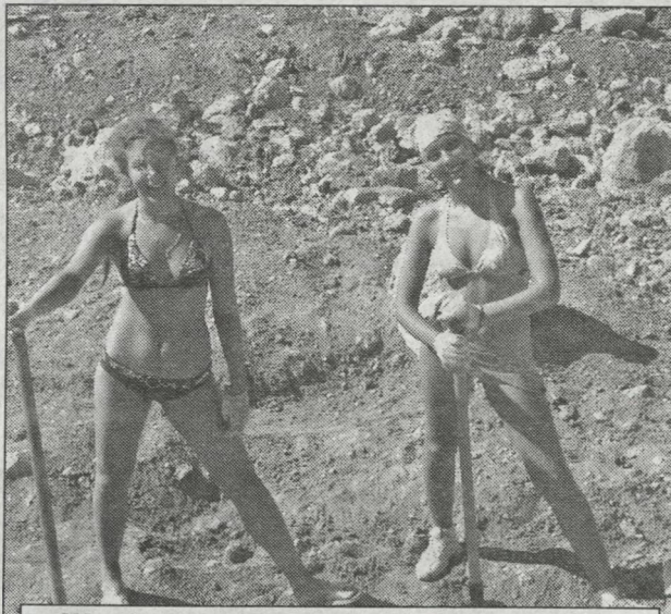
Жара стояла просто изнурительная, а потому рабочая одежда была такой...

Казалось бы, что можно делать, будучи оторванными от цивилизации, в полном смысле этого слова, и что может быть интересного в ежедневном раскапывании, зачистке, на первый взгляд, обыкновенных камней?! Возможно, людям других специальностей этого не понять, но археологи