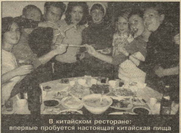
В китайском ресторане: впервые пробуются настоящая китайская пища

С международной олимпиады по китайскому языку, прошедшей с 29 сентября по 3 октября в приграничном городе Манчжурия, вернулась сборная команда факультета современных иностранных языков КрасГУ. Ребята приехали из Китая, полные волнующе-сказочных впечатлений; и с бронзовой победой. Олимпиаду организовала Манчжурская школа для русских по изучению китайского языка "Сяо ян", довольно известная в России. Участие в олимпиаде приняли около 80 студентов из Читинского педагогического университета, Читинского технического университета, Иркутского института иностранных языков и КрасГУ, а также сама школа. Она же и заняла 1 место, Читинский педуниверситет — второе.