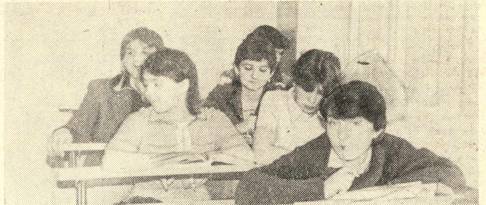
НА СНИМКЕ: лекцию слушают первокурсники биолого-химического факультета.

СЕГОДНЯ В ГАЗЕТЕ О СЕБЕ РАССКАЗЫВАЕТ ПЕРВЫЙ КУРС КрГУ.