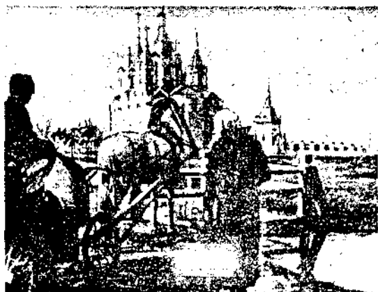
Собор в Красноярске

города»; он отметил, что городской парк «слывет лучшим во всей Сибири». Сохранились фотографии Ф.Нансена за рабочим столом в особняке Гадаловых, вид Кафедрального собора, панорама Красноярска тех дней.