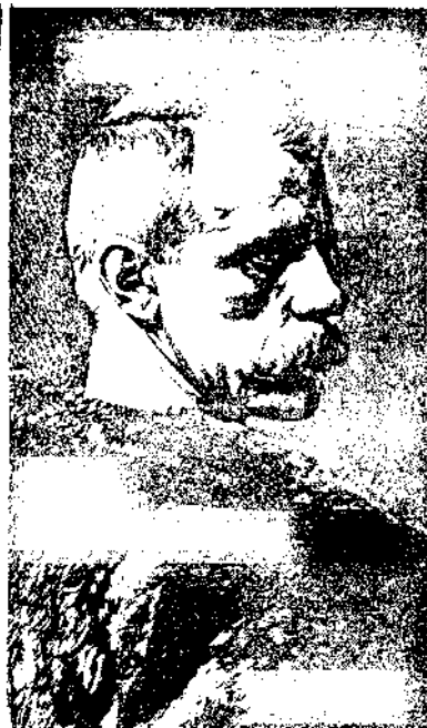
Фритьоф Нансен перед плаванием на «Фраме»

«Нансен возвращается», - под таким заголовком в начале 2001 г. в газете «Красноярский рабочий» был опубликован материал, в котором говорилось, что в Красноярске побывал директор независимого музейного агентства Джон Оге Геструм, благодаря которому был подготовлен и осуществлен проект норвежского музеолога профессора регионального университета г.Телемарка Марка Моора «Память о Нансене / Взгляд Нансена» об учёном, выдающемся путешественнике, побывавшем в Приенисейском крае и оставившем заметный след в изучении Сибири [1]. В заметке также сообщалось, что материал о Фритьофе Нансене будет представлен на IV Красноярской международной музейной биеннале, которая пройдёт в Красноярском культурно-историческом центре на Стрелке под девизом «Искусство памяти» в начале июня нынешнего года.