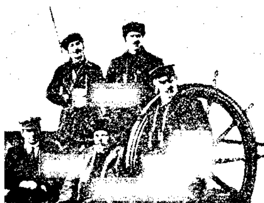
Стоят (слева направо): И.Г. Лорис-Меликов, И.И. Лид, Ф. Нансен; сидят (слева направо): капитан И. Самуэльсон, С.В. Востротин