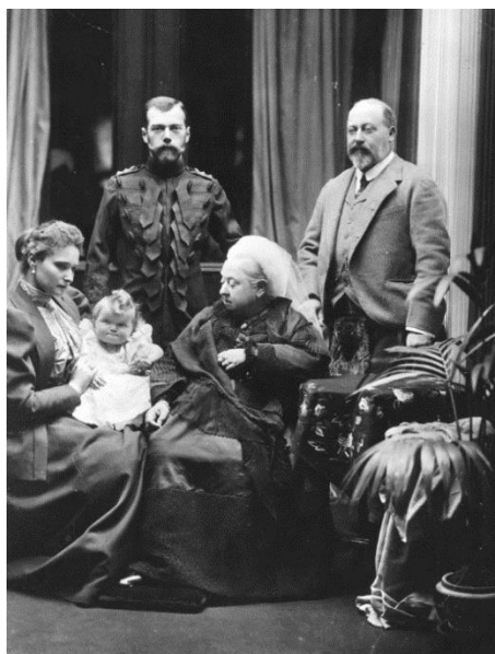
Рис. 5. Визит Николая II в Англию в 1896 г. (фото из интернета)

Известно, что в 1902 г. Николай II заказал известному русскому художнику В. Серову написать картину, где царь позирует в мундире полковника 2-го шотландского драгунского полка (рис. 6). Нарисованная картина была отправлена в Англию в подарок подшефному полку, где была помещена в казарму названного полка.