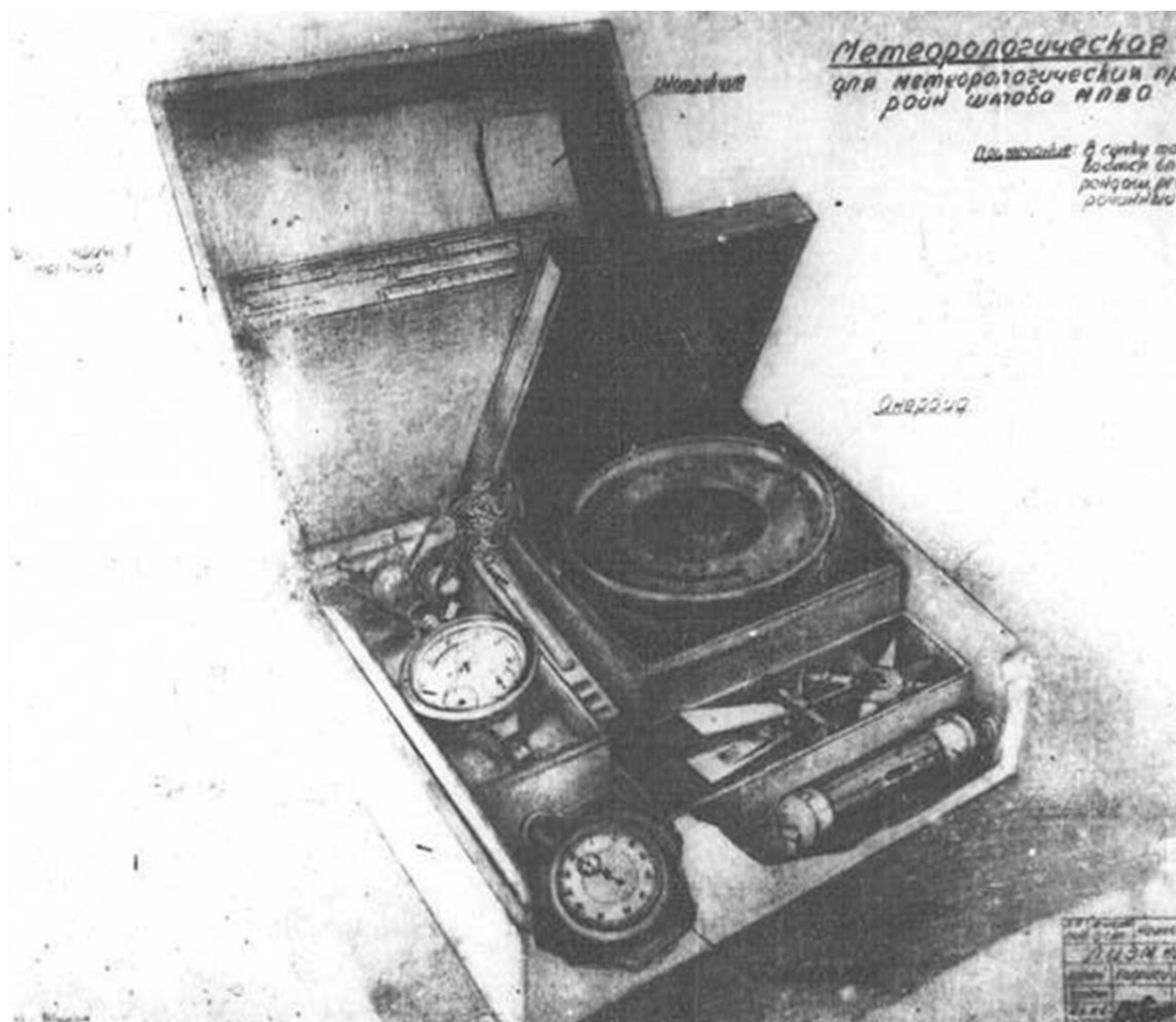
Рис. 3. Ящик с метеоприборами

Существенным вопросом являлось обеспечение партизан необходимым количеством средств наблюдения за погодой. Как правило, в распоряжении каждого пункта наблюдений был небольшой набор приборов, позволяющих регистрировать основные параметры атмосферы (рис. 3). Для их переноски использовался брезентовый мешок или ящик. В качестве инструкции к комплекту прилагалась «Памятка наблюдателю».