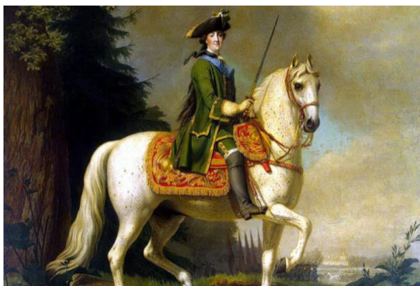
Рис. 2. Императрица Екатерина II верхом на коне Бриллианте. 1762 г.

Супруга императора Петра III, великая княгиня Екатерина Алексеевна, будущая императрица Екатерина II, отправилась брать власть в свои руки в военной форме – в офицерском мундире лейб-гвардии Семеновского полка (рис. 2). И Екатерина II хорошо помнила, кому она обязана престолом. Поэтому сразу после коронации объявила себя шефом нескольких российских полков.