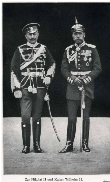
Рис. 4. Два императора: Вильгельм II в русской форме, Николай II в немецкой форме

В качестве ответной любезности, российский император получил военный мундир одного из полков немецкой армии (рис. 4).