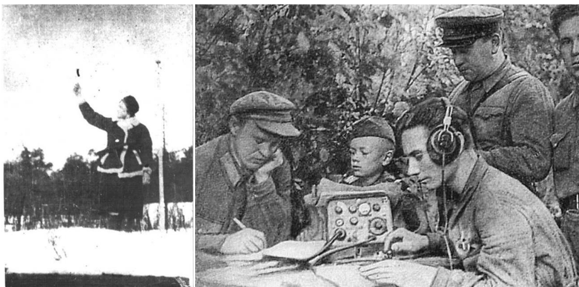
Рис. 2. Метеонаблюдения и передача их результатов в партизанском отряде

Этот основополагающий документ положил начало дальнейшей детализации уже на региональном уровне. К примеру, 9 сентября 1943 г. начальником Белорусского штаба Партизанского движения (далее – БШПД) была утверждена Инструкция для комендантов партизанских посадочных площадок и метеорологических наблюдателей. Документ объявлял наблюдателей представителями БШПД и АДД, предписывал им проводить наблюдения и передавать их результаты дважды в сутки (утром и вечером) (рис. 2).