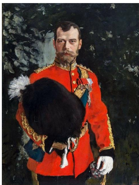
Рис. 6. Николай II в мундире полковника 2-го шотландского драгунского полка

Известно, что в 1902 г. Николай II заказал известному русскому художнику В. Серову написать картину, где царь позирует в мундире полковника 2-го шотландского драгунского полка (рис. 6). Нарисованная картина была отправлена в Англию в подарок подшефному полку, где была помещена в казарму названного полка.