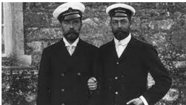
Рис. 7. Адмиралы английского флота: Николай II и Георг V

фотографии (рис. 7) представлены два адмирала английского флота: царь Николай II (слева) и английский король Георг V (справа).