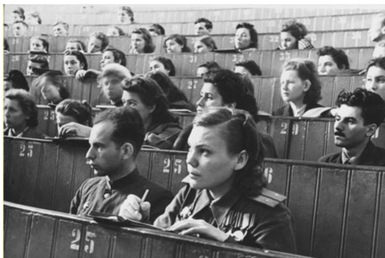
Рис. 1. Большая Коммунистическая аудитория МГУ. 1 сентября 1945 г.