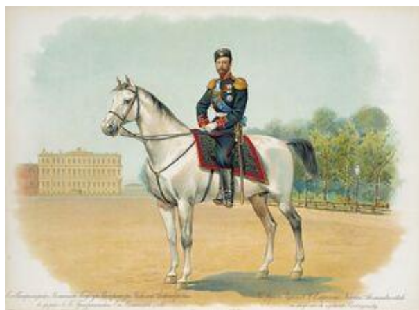
Рис. 1. Николай II в форме Лейб-гвардии Преображенского Его Величества полка

За сухими датами и цифрами этой таблицы скрывается немало различных событий, связанных с наследованием российского престола. Большинство императоров и императриц объявляли себя шефами Преображенского полка сразу после кончины своего предшественника, а некоторые даже день в день. Так было с Елизаветой Петровной, Петром III, Екатериной II, Александром II. Некоторым для этого потребовалось несколько дней, а то и недель. К примеру, Анне Иоанновне, которой предстояло дожидаться объявления о решении Верховного тайного совета, Николаю I в связи с задержкой официального отказа от престола его старшего брата Константина. А Иоанну VI пришлось ждать назначения почетным шефом более трех недель, по вполне очевидной причине – в момент объявления его императором, возраст его был ... два месяца и этот вопрос, конечно, решал не он, а другие лица. В справочных изданиях сообщается такой интересный факт, что будущий император Александр III был назначен вторым шефом Преображенского полка осенью 1866 г., когда на престоле еще находился его отец – император Александр II. И поэтому наследник престола, а позднее и император был почетным шефом гвардейского Преображенского полка почти 28 лет, хотя российским императором он являлся лишь 13 лет.