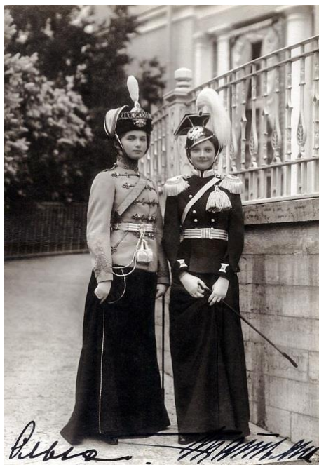
Рис. 3. Княгини Ольга и Татьяна. 1910 г.

пола, в том числе к супруге и к дочерям последнего российского императора Николая II. На представленной фотографии (рис. 3), сделанной в 1910 г., две его дочери – великие княгини Ольга и Татьяна – представлены в специально изготовленной для них военной форме «своих» полков. Княгиня Ольга в мундире почетного шефа 3-го гусарского Елизаветградского полка, а княгиня Татьяна в мундире почетного шефа 8-го Вознесенского уланского полка.