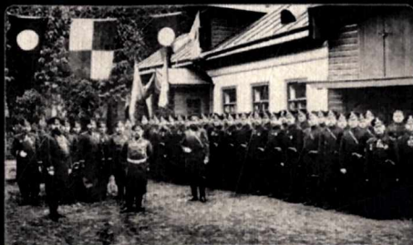
Офицеры на освещении 4-го полицейского участка Петербургской части Санкт-Петербург, Россия, 1913