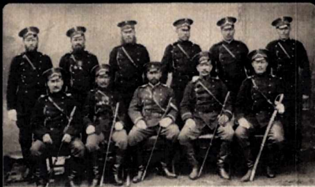
Кавалерийско-полицейская стража Петроград, Россия, 1915