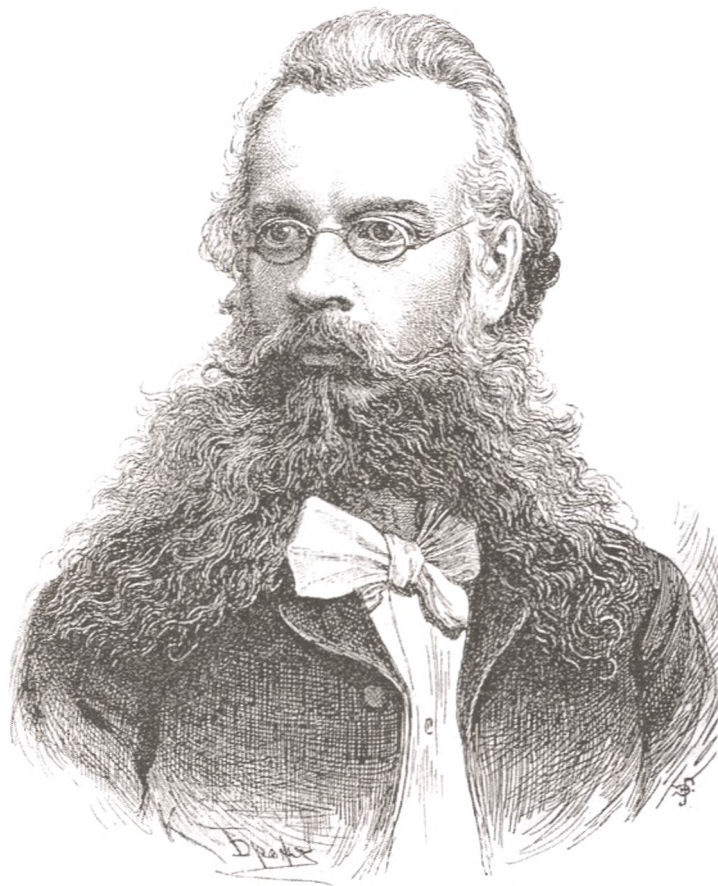
Николай Михайлович Ядринцев.

Гравюра с фотографии из журнала «Всемирная иллюстрация». 1894 г.