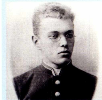
Валентин Войно-Ясенецкий в студенчестве