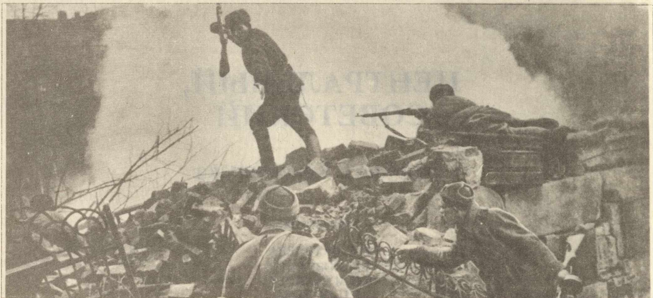
В атаку! Уличные бои в Бреслау. 1945

Кто из фронтовиков не помнит ночь перед боем? Чем был занят солдат? Писал письма домой родным и близким. А некоторые из них писали стихи. В Книге Памяти публикуются отрывки из писем и стихи наших земляков, не вернувшихся с войны.