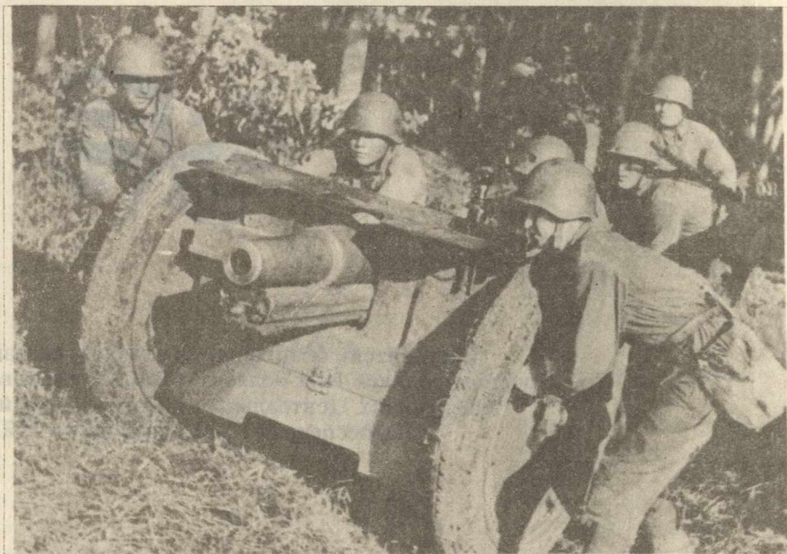
На новый огневой рубеж