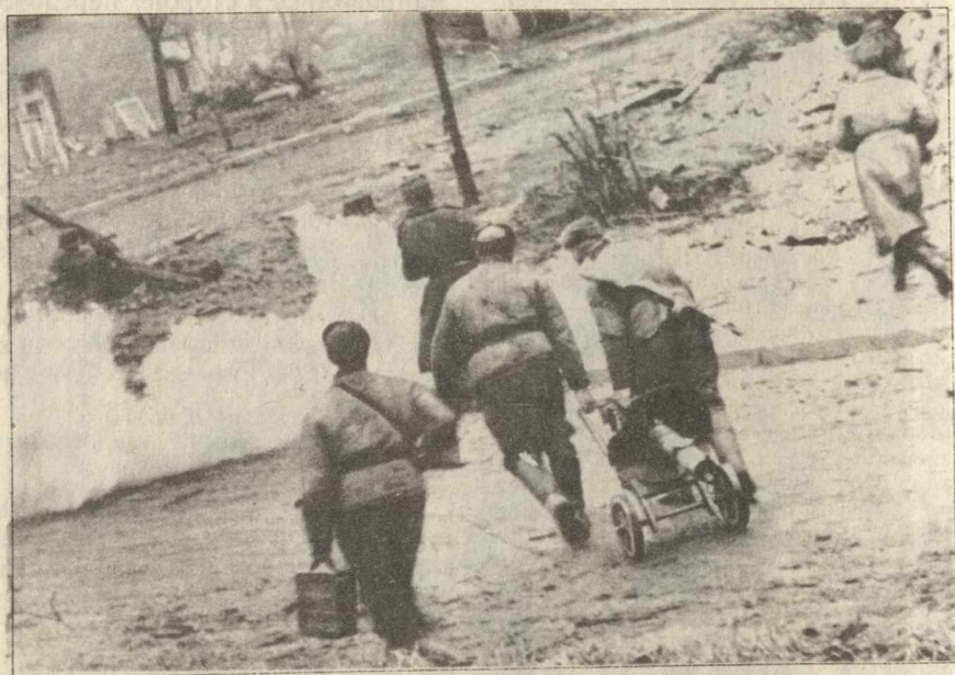
Расчет станкового пулемета меняет огневую позицию