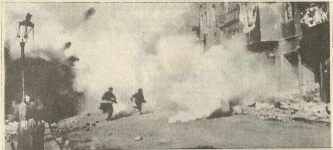
Уличные бои в Германии