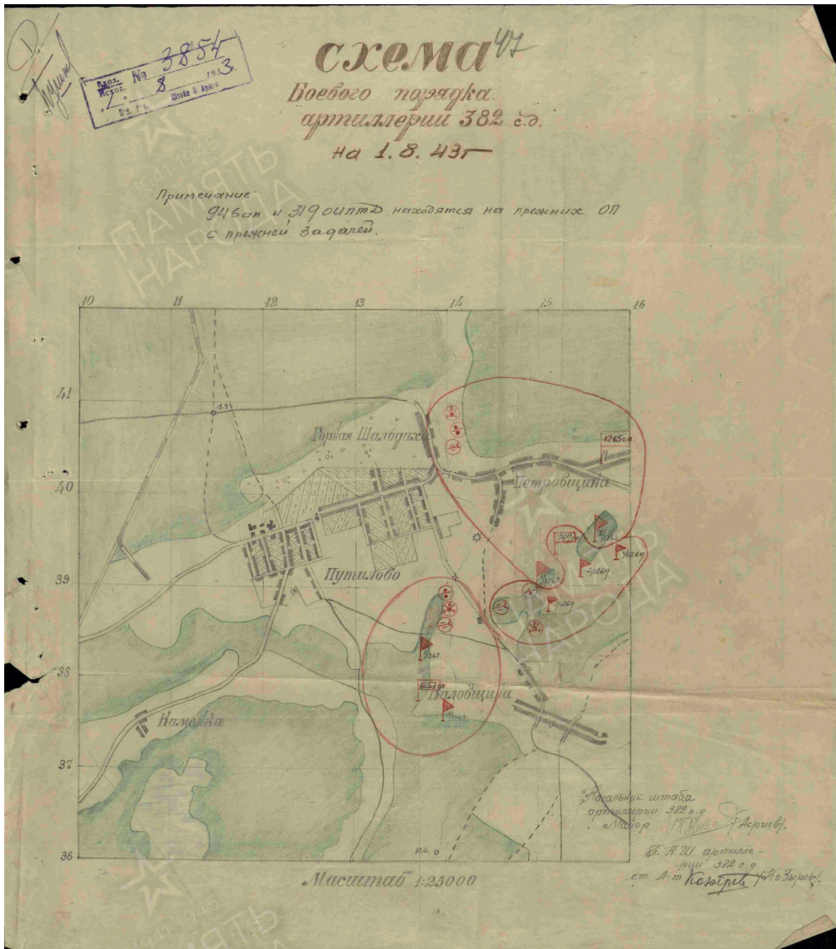
Рис. 2. Схема боевого порядка артиллерии 382-й стрелковой дивизии на 1 августа 1943 года