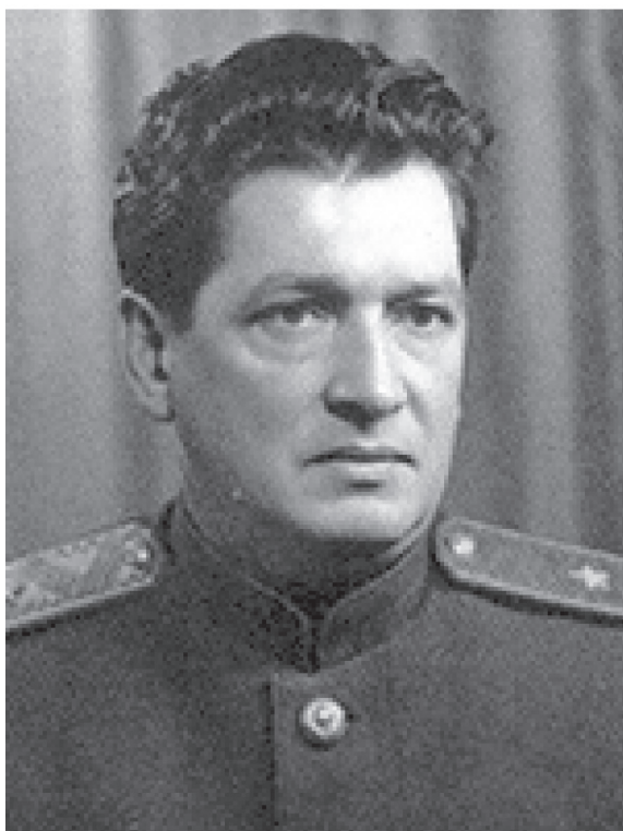
Михаил Фомич Ковшук-Бекман (начальник Управления НКГБ-МГБ по Красноярскому краю в 1943–1948 годы)

В Красноярском крае Управлением НКВД СССР продолжил руководить полковник государственной безопасности И.П. Семенов (с 1946 года МВД