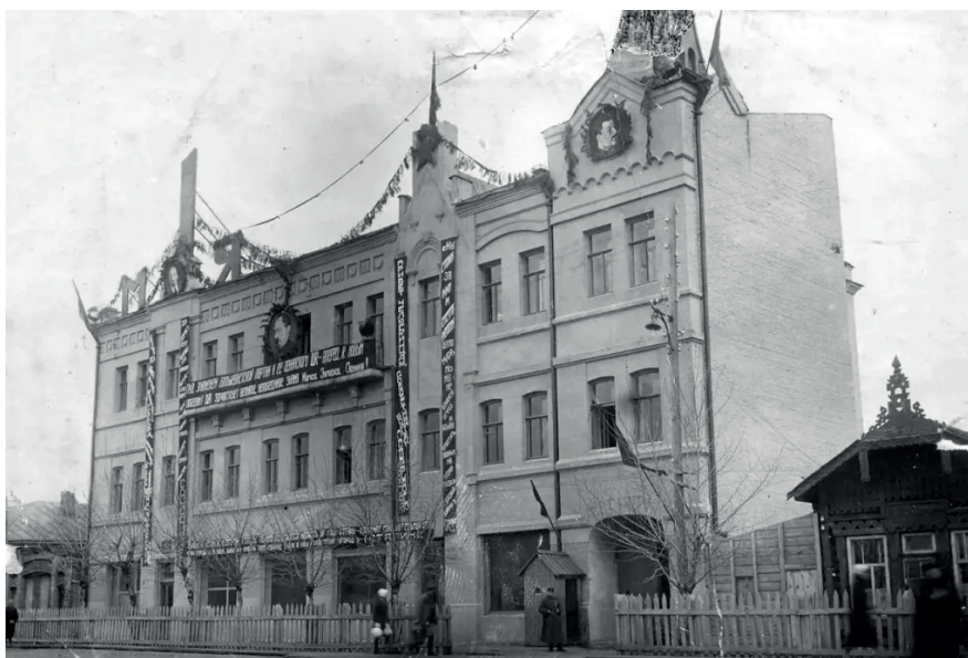
Красноярское управление НКВД-НКГБ СССР 1930–1940-е годы

директивы № 127/5809 и о мероприятиях, проводимых УНКГБ в связи с начавшимися военными действиями с Германией. В шифрограмме в центральный аппарат НКГБ И.П. Семенов доложил о том, что им приказано обратить особое внимание на изъятие разрабатываемых контрреволюционных, шпионских и белогвардейских элементов, которые более всего присутствуют в кругах польских осадников, спецпереселенцев из западных областей Украины и Белоруссии [5, 59].