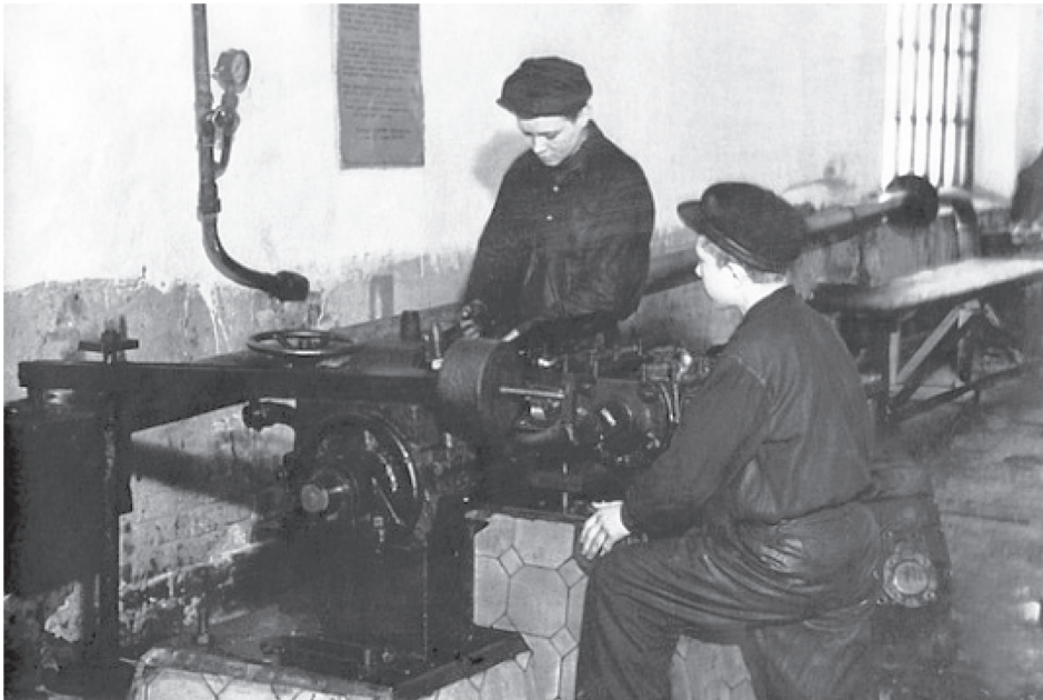
Рис. 1. Паровозное депо ст. Иланская. Подростки за работой [9, с. 55]

пенова из литейного цеха красноярского локомотивного депо в 1943 году довела производственную выработку до 457 %, их пример вдохновил на такой же ударный труд десятки молодежных бригад и смен в различных подразделениях дороги.