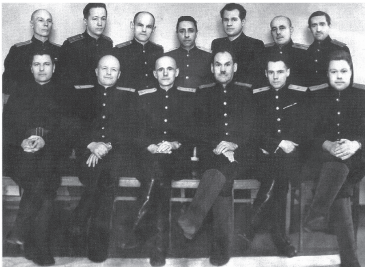
Руководящий состав управления милиции Управления НКВД СССР по Красноярскому краю (1943 г.)

Борьба с преступностью оставалась одной из основных задач органов НКВД. С началом Великой Отечественной войны