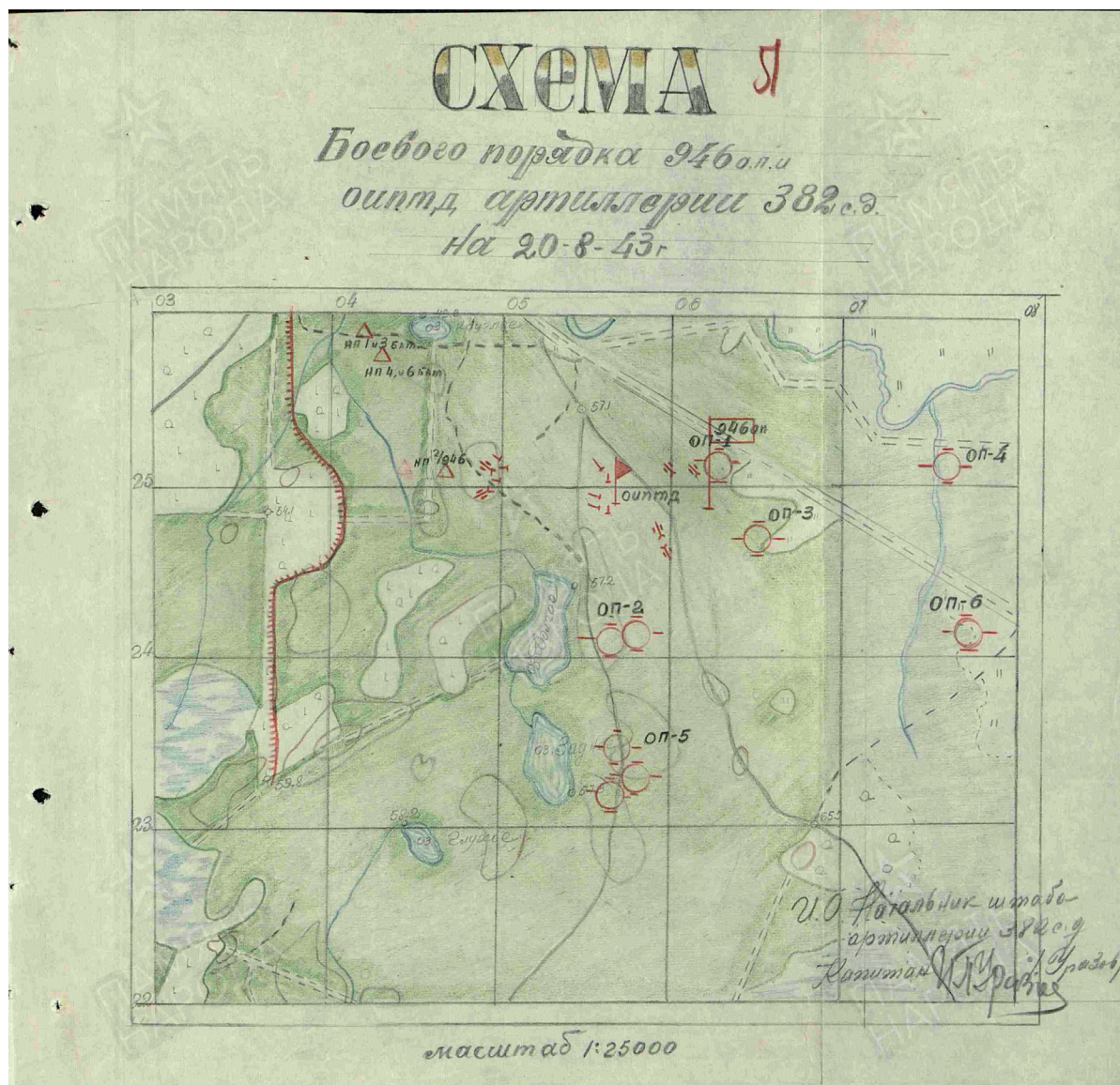
Рис. 3. Схема боевого порядка 946-го ап и 319 оиптдн 382-й сд на 20 августа 1943 года

ник, проводя перегруппировку сил, трижды контратаковал позиции 937-го стрелкового полка группами по 80–150 человек, пытаясь отбить ранее утраченную высоту. Согласованным огнем воздействием