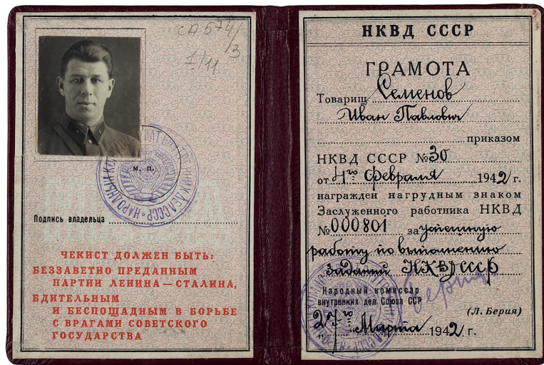
Иван Павлович Семенов (начальник Управления НКВД - УВД по Красноярскому краю в 1941–1947 гг.)

органов, в том числе пять выездов в органы на дальнем севере [1, л. 57]. Эти поездки осуществлялись с целью контроля и проверки работы всей краевой системы правоохранительных структур и прежде всего деятельности по обеспечению государственной безопасности края.