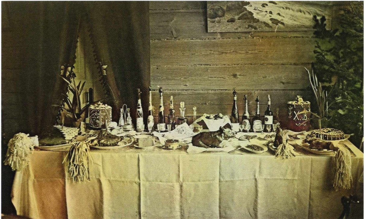
Пасхальный стол. Красноярск, 25 марта 1913 года

При Антонии во множестве строились новые храмы. Сейчас церкви на-