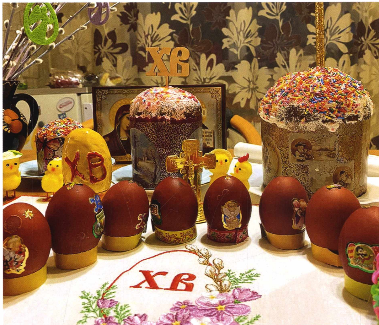
Пасхальный стол. Назарово, 2021 год

Естественно, когда создавалась Красноярская и Енисейская, потом её стали называть Енисейская и Красноярская епархия, на вечное житьё ей определили Красноярск, а не первый острог на Енисее — Енисейск.