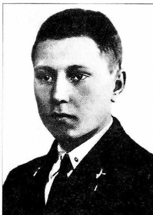
А. И. Покрышкин — авиатехник

И меня оставили в технической школе. Должен признаться, что это пошло на пользу: за несколько лет я в совершенстве изучил материальную часть самолета.