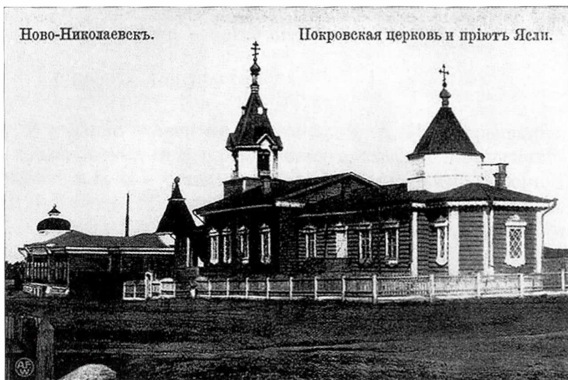
Церковь Покрова Пресвятой Богородицы. Начало XX в.

Будущий летчик родился в городе Ново-Николаевске 6 марта 1913 года, а 10 марта был крещен в городской Покровской церкви и получил при крещении имя Александр, что в переводе с древнегреческого означает «защитник» или «защитник людей».